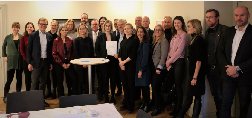
Samtliga undertecknare av avsiktsförklaringen.